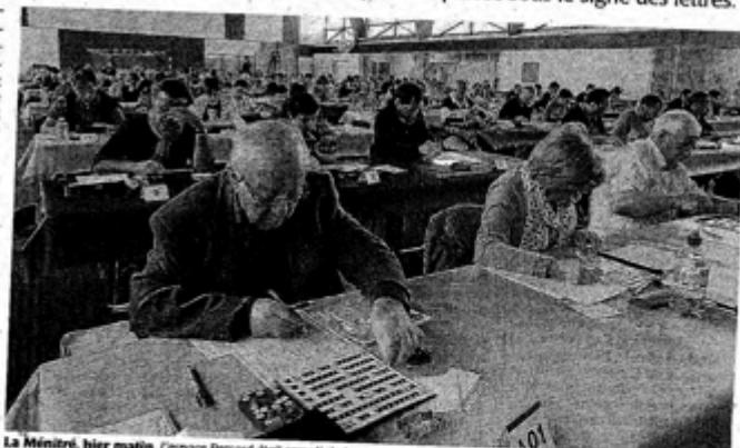
La Ménitrie, hier matin. L'espace Pessard était rempli de joueurs de scrabble concentrés sur leur grille.

Concentration, ambiance électrique, regard braqué sur les grilles, ici, pas question de chuchoter. Le tournoi avance au rythme des mots qui tombent toutes les quatre ou cinq minutes. Nous sommes l'un près de l'autre du scrabble familial, ici, les règles sont strictes et différentes. Les joueurs ont 3 minutes pour inscrire leur mot sur un papier. En une vingtaine de coups, la partie est jouée. « Il faut que le mot soit juste, au bon emplacement, et que les joueurs ne se trompent pas dans le