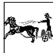
3 Etapes du Grand Prix

Les accompagnateurs non scrabbleurs sont les bienvenus et profiteront des avantages du Festival