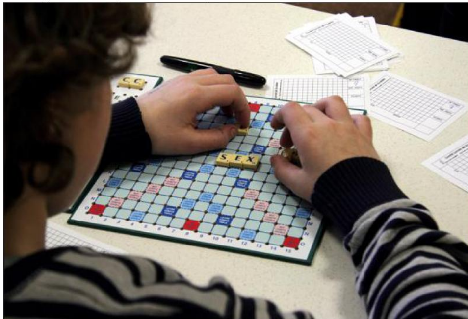
Le scrabble, un bon moyen pour les adolescents d'enrichir leur vocabulaire.