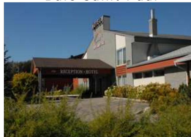
Hôtel Baie-Saint-Paul 3☆ ou similaire