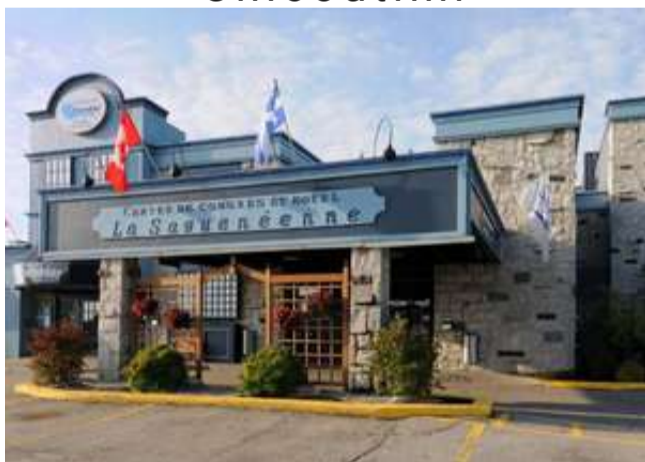
Hôtel la Saguenéenne 3☆ ou similaire