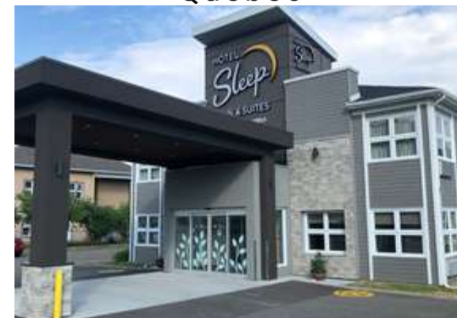
Sleep Inn & Suites Quebec City East 3☆ ou similaire