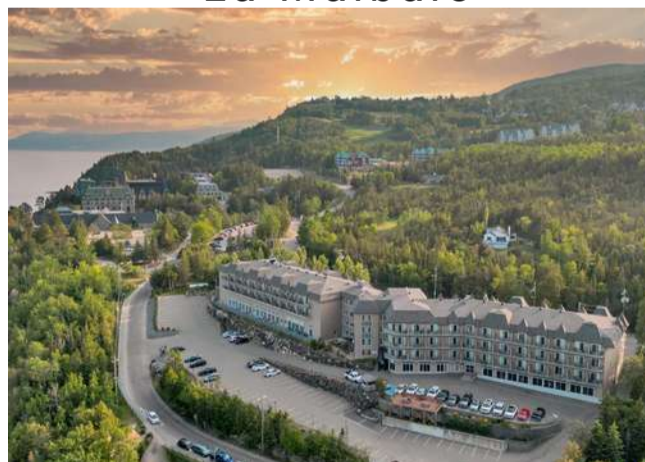
Hôtel le Petit manoir du Casino 4☆ ou similaire